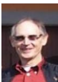
Arsène Flick -